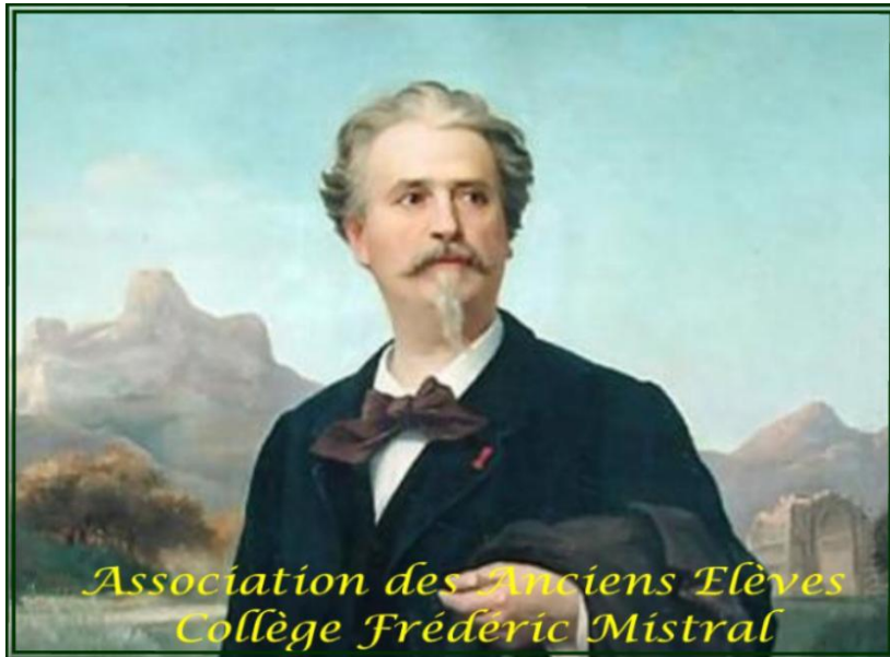
Portrait de Frédéric Mistral, par Félix-Auguste Clément